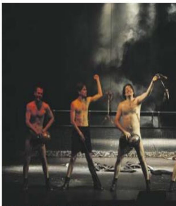
Striptýzu se diváci dočkají v závěrečné scéně muzikálu Donaha!